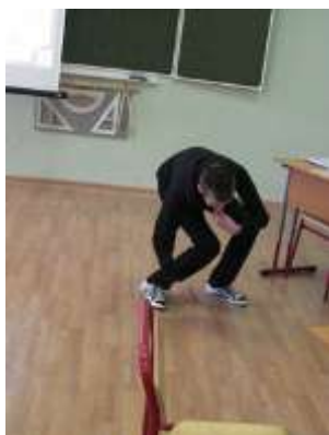
«Пятое колесо в телеге»