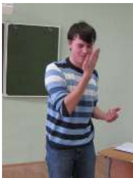
«У семи нянек дитя без глаза»