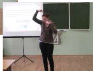
«Ум хорошо, а два лучше»