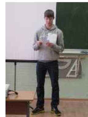
«Красная шапочка» в математических терминах