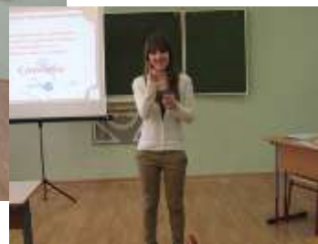
«Не имей сто рублей, а имей сто друзей»